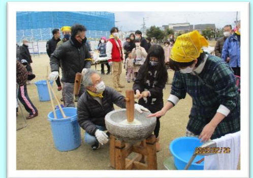
■地域交流 餅つき大会