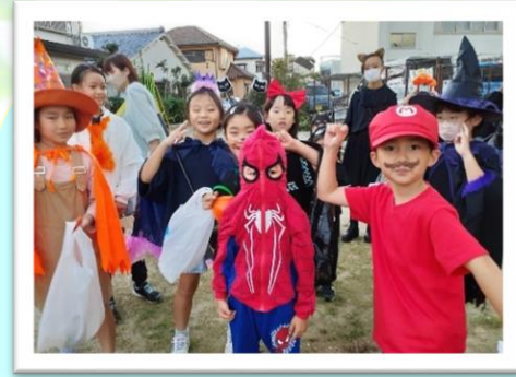
■わくわくカーニバル