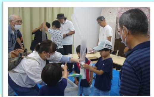
■伝承 昔の おもちや 作り