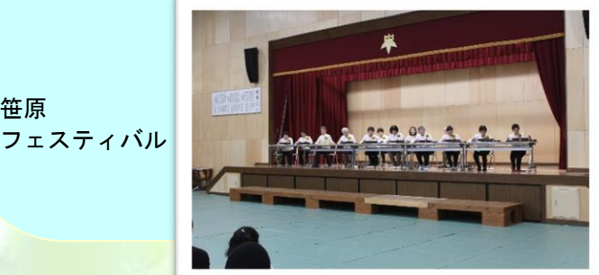
■笹原 フェスティバル