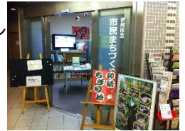
市民まちづくりプラザオープン