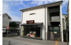
ことば蔵 オープン