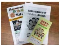
自治会活動のヒント