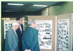
コミュニティ活動パネル展