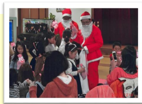
■花里とんとんクリスマス会