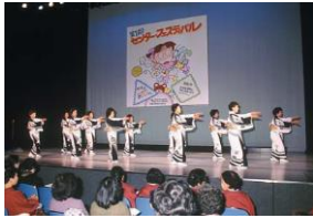
第1回センターフェスティバル