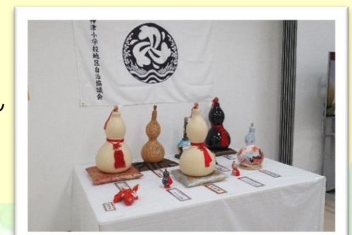
■ひょうたん 作品展