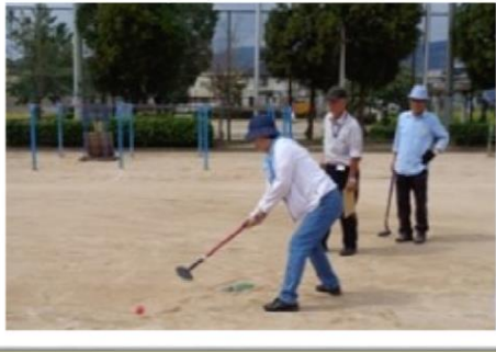
■ グラウンド ゴルフ