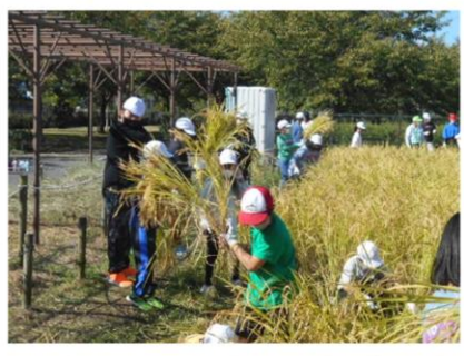
■ 田植え (稲刈り)